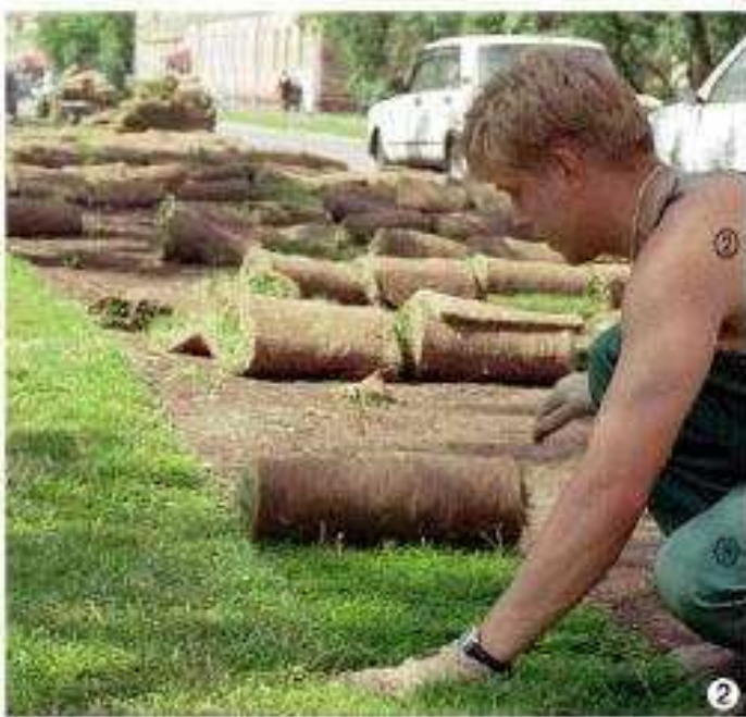
② Основа хорошего газона — тщательно подготовленная почва. Уложить рулоны на таком участке не составляет труда.